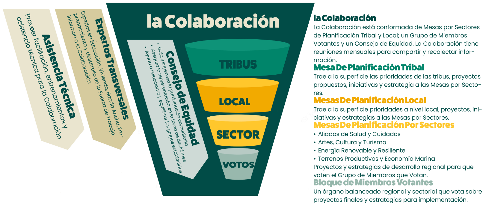
Diagrama de Flujo de la Fase de Planificación